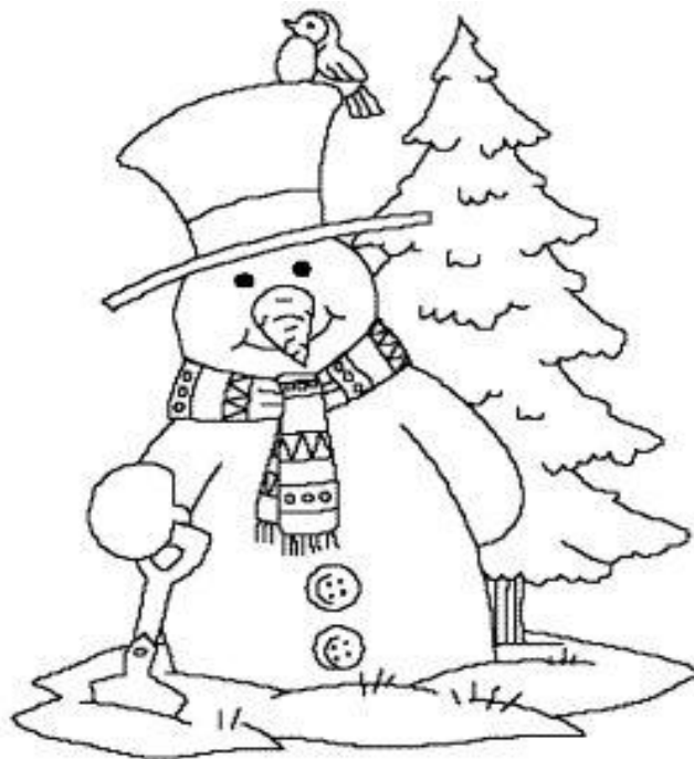
Omalovánka pro děti