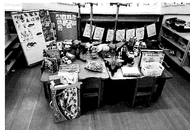
Ježíšek ve školce