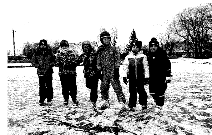
parta bruslařů ze ŠD