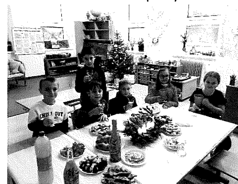
Vánoce ve škole