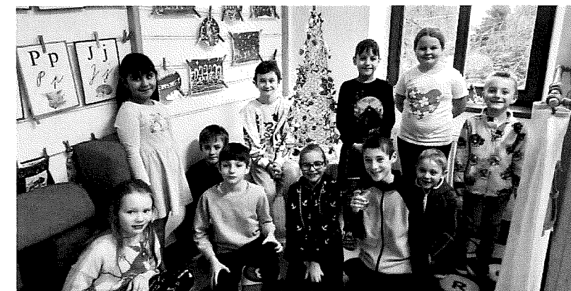
návštěva v Křižánkách