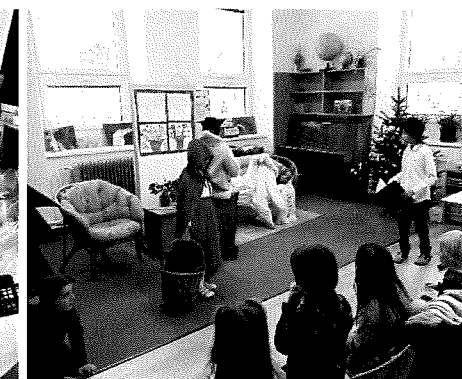
O červené Karkulce